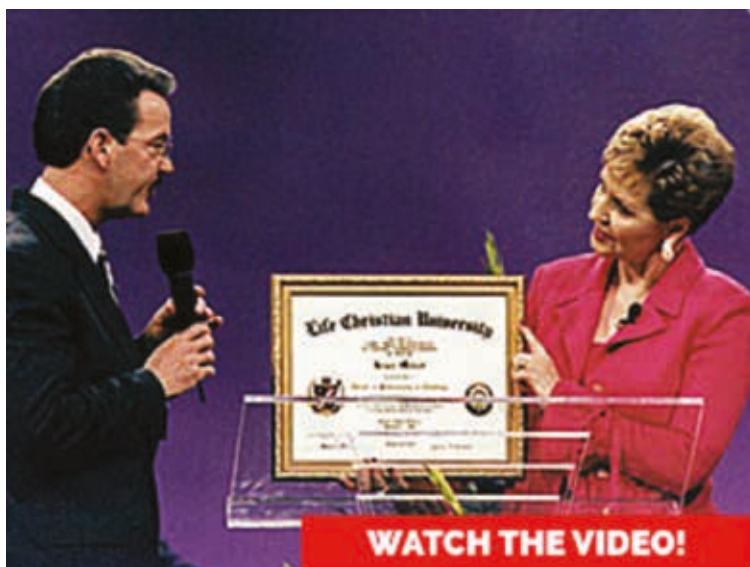
Dr. Joyce Meyer Ph.D. in Theology

следният: „Повечето книги, които използваме са от брат Хегин, брат Коупланд и други служители на вярата. Ние определено сме Слово на вяра.“ 14